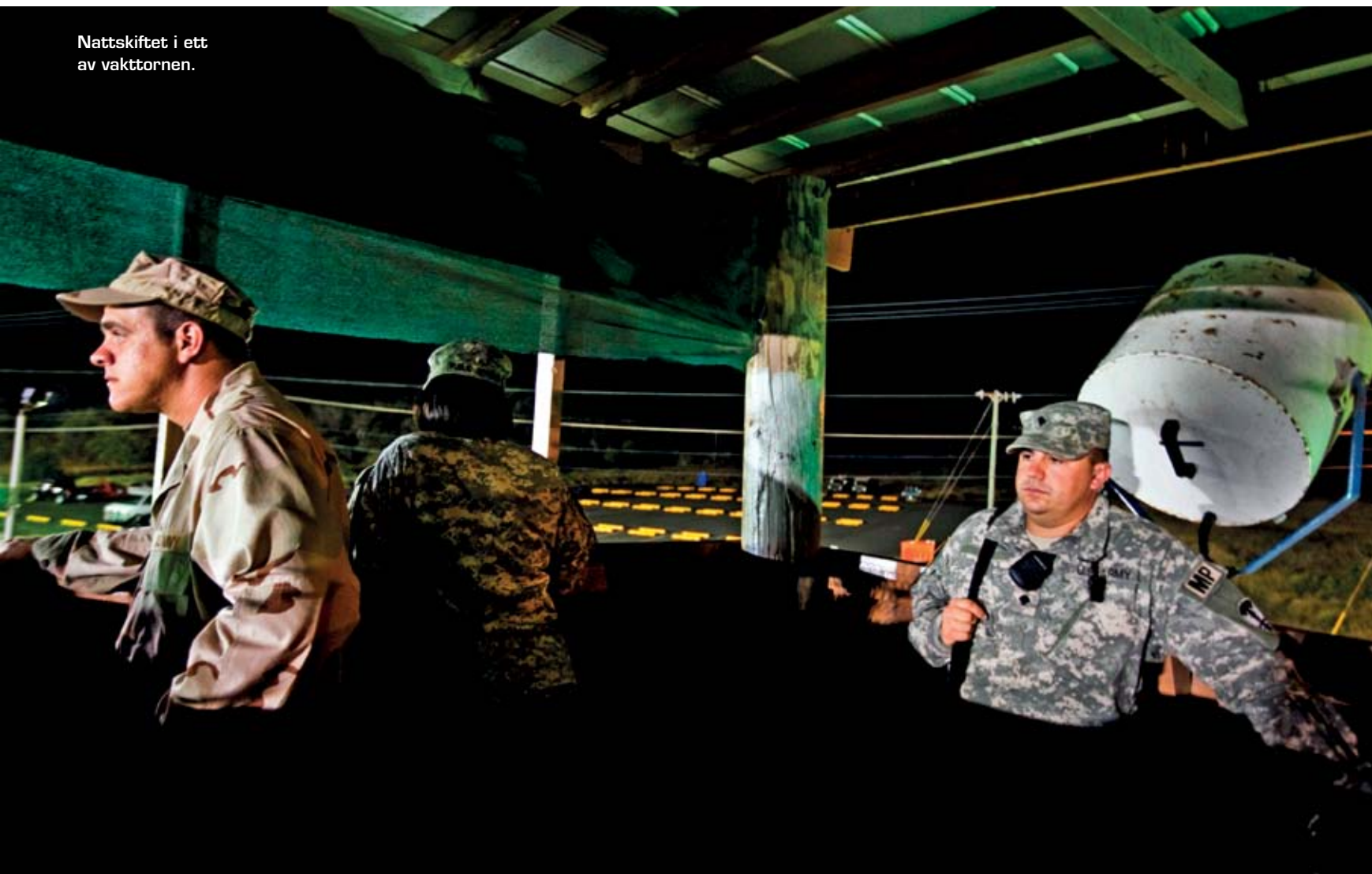
Nattskiftet i ett av vakttornen.