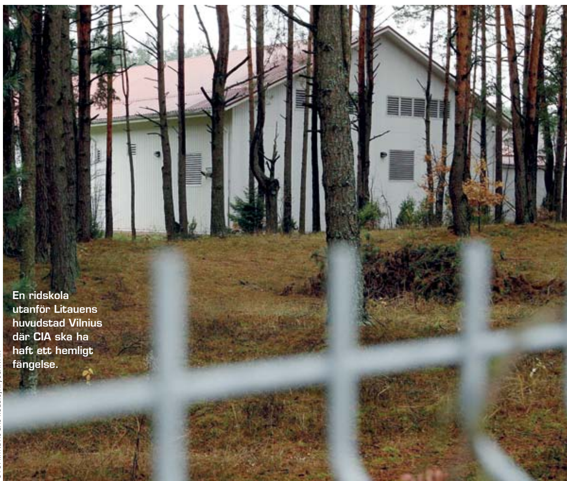
En ridskola utanför Litauens huvudstad Vilnius där CIA ska ha haft ett hemligt fängelse.

I februari år 2010 lade fyra FN-organ fram en gemensam rapport med ytterligare bevis och där utpekades Tyskland som medskyldigt i ett fall av hemligt fängslande vilket gick stick i stäv med den nationella tyska undersökning som hade friat alla tyska statliga aktörer från inblandning. I november 2010 kom Amnesty International