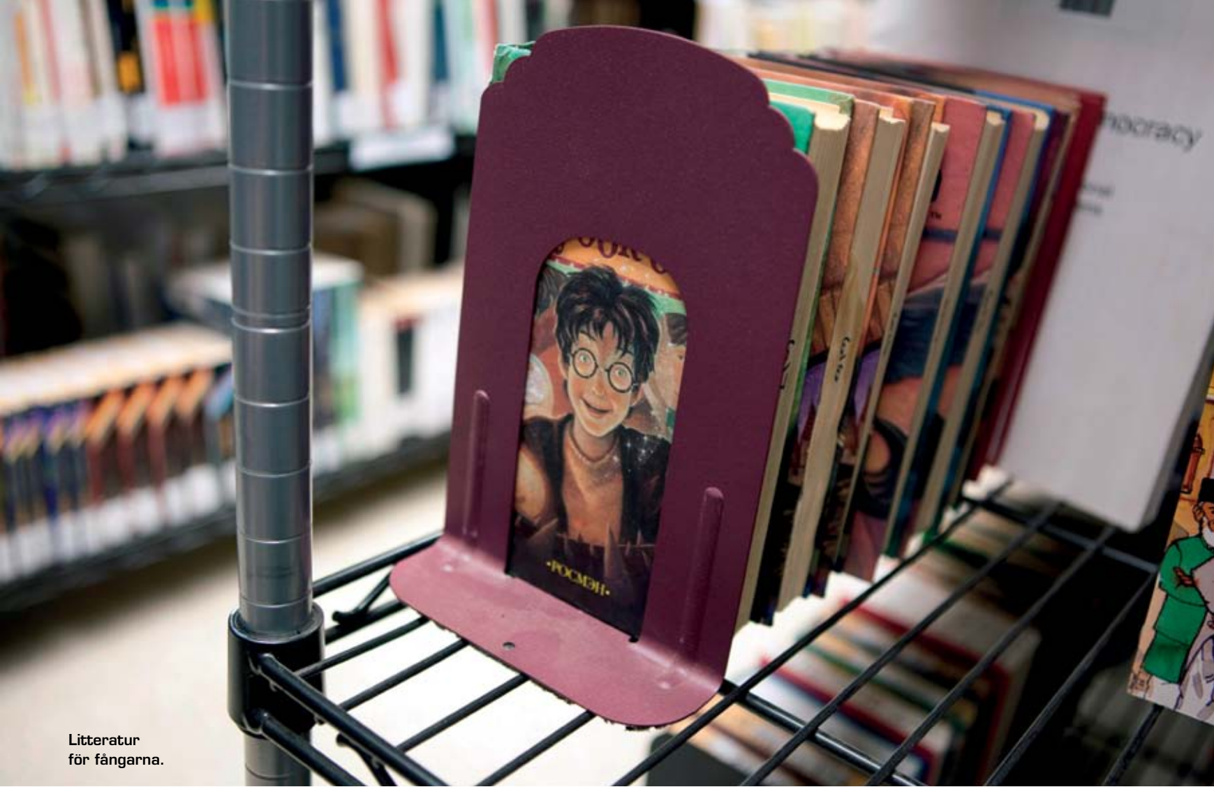
Litteratur för fångarna.