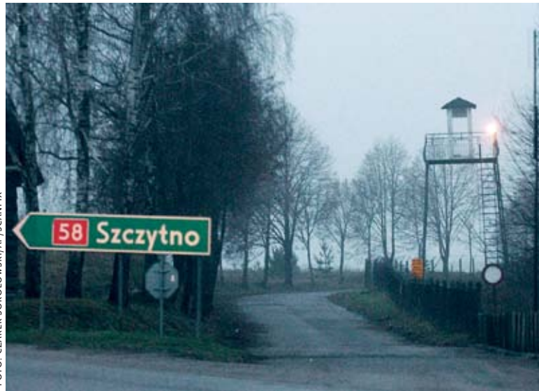
Här i nordöstra Polen ska CIA ha haft ett hemligt fångelse.

– Först och främst för att offren har rätt att veta sanningen om vad som