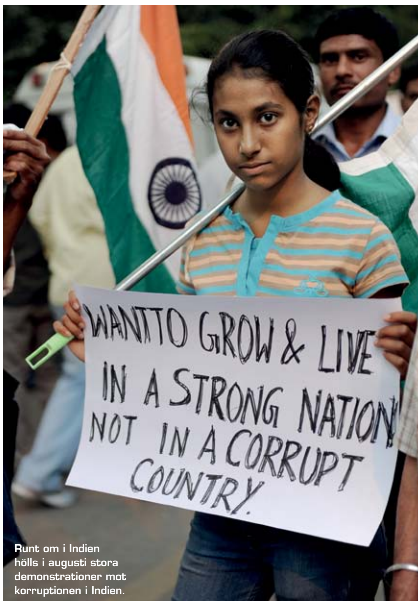
Runt om i Indien hölls i augusti stora demonstrationer mot korruptionen i Indien.

»Vad som tidigare kallats ifrågasättande av staten har idag kriminaliserats.«