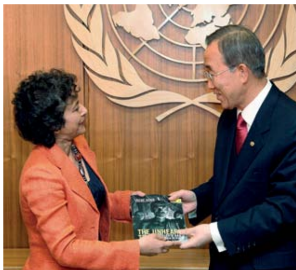
Irene Khan överlämnar sin bok om fattigdom till FN-chefen Ban Ki-moon.