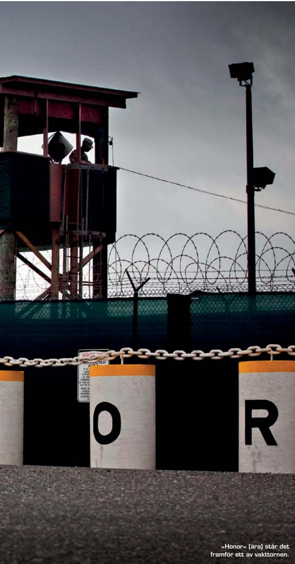
»Honor« (ära) står det framför ett av vakttornen.

Här finns fångsläget som har blivit ett politiskt slagträ mellan politiker i USA. Här finns 165 fångar som är isolerade från omvärlden. Några av dem har suttit fängslade i snart tio år utan att ställas inför rätta. Ytterligare sex fångar har dömts vid den speciella militärdomstolen på Guantánamo och avtjänar sina straff i läget. ➤