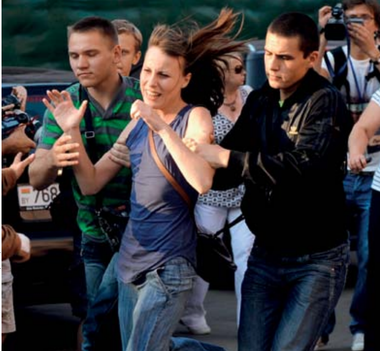
Minsk den 20 juli: Civilklädd polis lyckades gripa omkring 50 personer som samlats till en tyst »klappa-i-händerna«-protest.